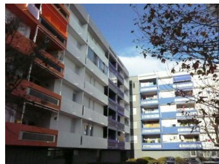
Caractéristiques des vides des gardes corps